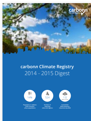
carbonn Climate Registry 2014-2015 Digest